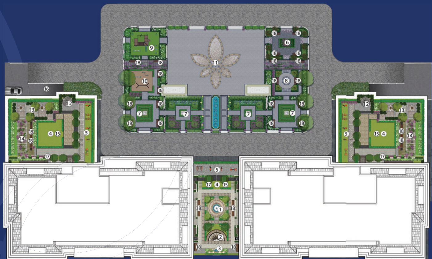
[ Tầng 1 & Tầng 25 ]