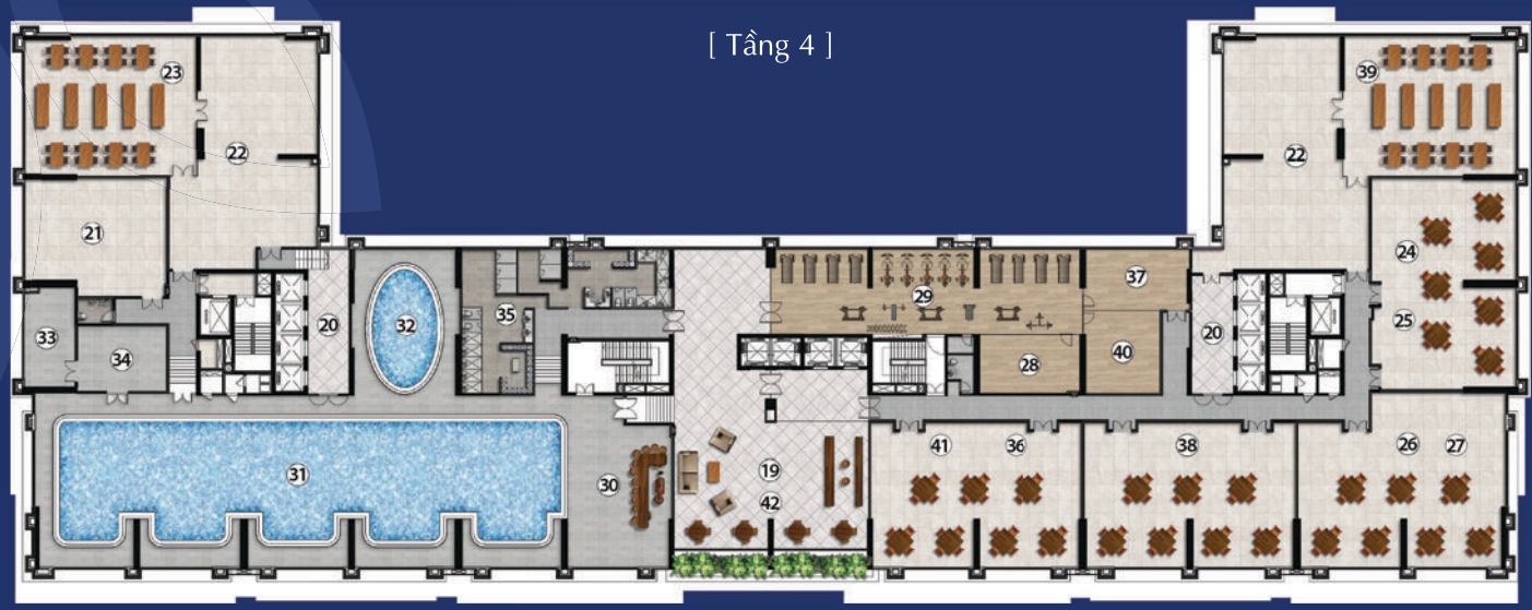
[ Tầng 4 ]